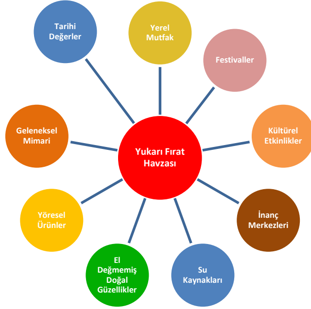
Şekil 1: Yukarı Fırat Bölgesi Turistlik Değerleri

Bu minvalde, bölge illerinin turizm alanındaki potansiyelini 2024 – 2028 Bölgesel Gelişme Ulusal Stratejisi'nde belirtildiği gibi destinasyon ve tema odaklı bir yaklaşımla geliştirmek önem arz etmektedir. Nitekim, ilgili sonuç odaklı program kapsamında ajans, Fırat'ı Keşfet markası ile bölgenin turizm gelirlerini artırmaya yönelik stratejiler geliştirmiştir. Destinasyon markalaşması Fırat'ı Keşfet Projesi çerçevesinde belli bir seviyeye gelmiştir. Web sitesi ve sosyal medya hesapları aktif olarak kullanılmakta olup ilk defa özgün olarak bölgede uygulanan “Fırat Turu Destek Programı” ile bölgeye yönelik düzenli tur faaliyetleri başlatılmıştır. Marka bilinirliğinin artması amacıyla etki sahipleri (influencer) ile iş birlikleri ve fam tripler düzenlenmiştir. Turizm Memnuniyet Analizi çalışması ile bölgenin turizm alanında geliştirilmesi gereken yönleri belirlenmiştir. Bununla birlikte, pandemi ve 6 Şubat 2023 depremleri nedeniyle marka bütünlüğünü oluşturması açısından önem arz eden bazı faaliyetler sektöre uğramış olup mevcut SOP faaliyetlerinin yoğunlaştırılarak devam etmesinin faydalı olacağı değerlendirilmektedir.